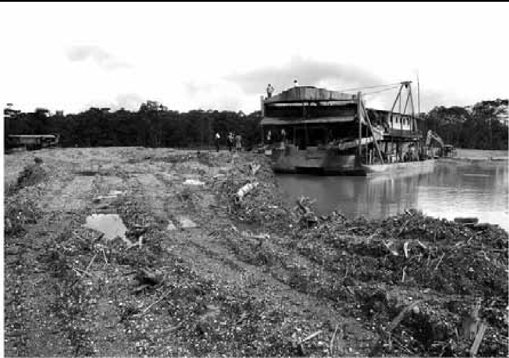
Cascote de la draga brasileira Maquina do tempo, en el río San Pablo.