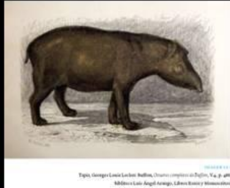
Tapir, Georges Louis Leclerc Buffon, Ouvrages complètes de Buffon , V.4, p. 49. Biblioteca Luis Ángel Arango, Libros Raros y Manuscritos.

En cuanto a los seres humanos, Buffon manifiesta la inferioridad del hombre americano “El salvaje es dócil y sus órganos reproductivos son pequeños, no tiene bello ni barba, no tiene deseos por su hembra: aunque más ligero que el Europeo por su costumbre de correr, es sin embargo menos fuerte; es también menos sensible y sin embargo más miedoso y más perezoso. No presenta vivacidad alguna, ninguna actividad del alma; la actividad corporal no es un movimiento voluntario, una mera respuesta a la necesidad; si le quitamos el hambre y la sed, se destruirá el motivo de sus movimiento, y se mantendría en reposo durante días enteros”